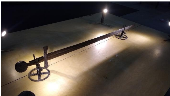
3. Zwaard.