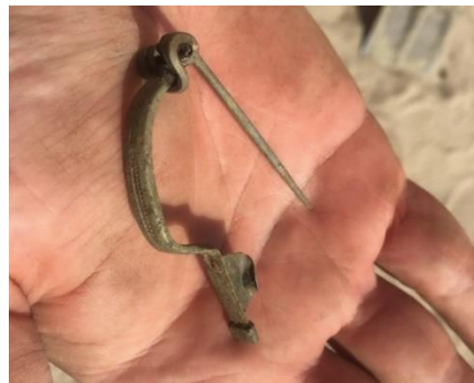
2. Fibula (mantelspeld).