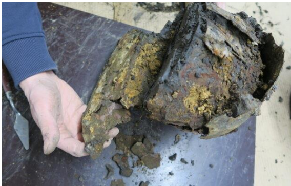
1. Helm.

Bekijk de volgende foto's. Deze voorwerpen zijn allemaal in Nieuwegein gevonden.