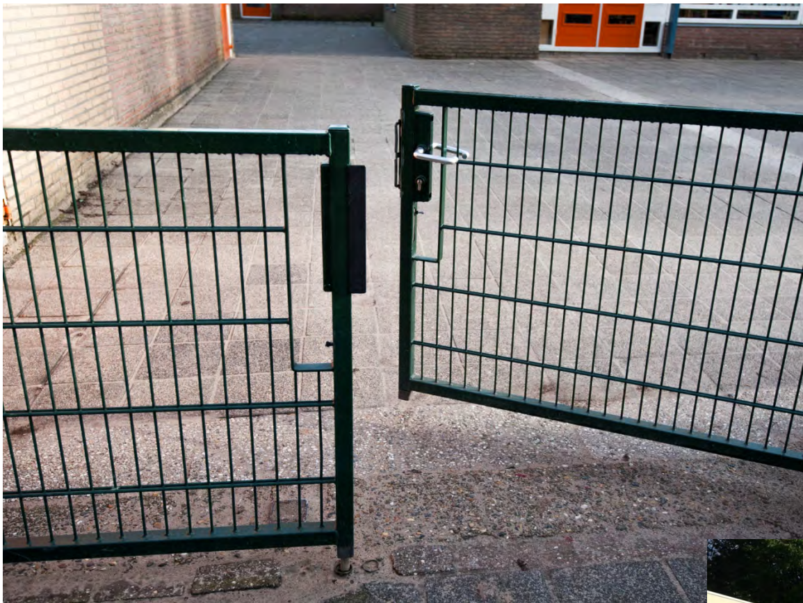
Het hek van de school