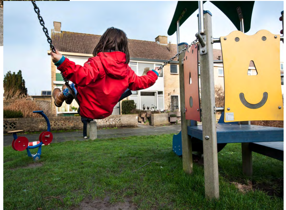
De kleine speeltuin, na school kan ik daar spelen