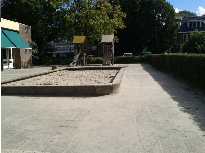
en het speelplein